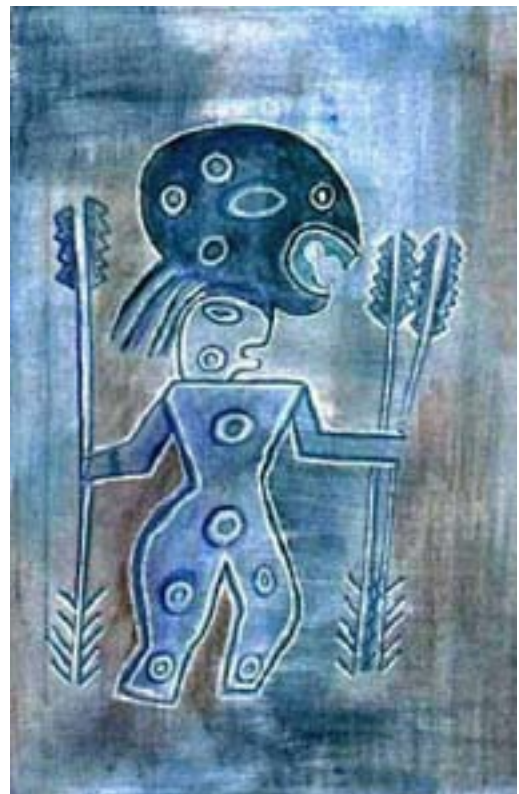
Periodo aguada guerrero traje festivo

Culturas de raíces desconocidas que han dado lugar a un sinnúmero de mitos y leyendas.