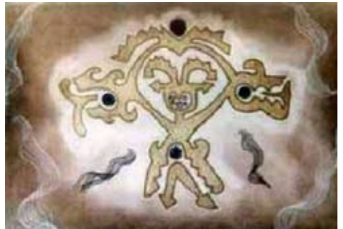
Del periodo aguada noroeste argentino

Nunca comprendieron por qué los españoles necesitaban tanto oro.